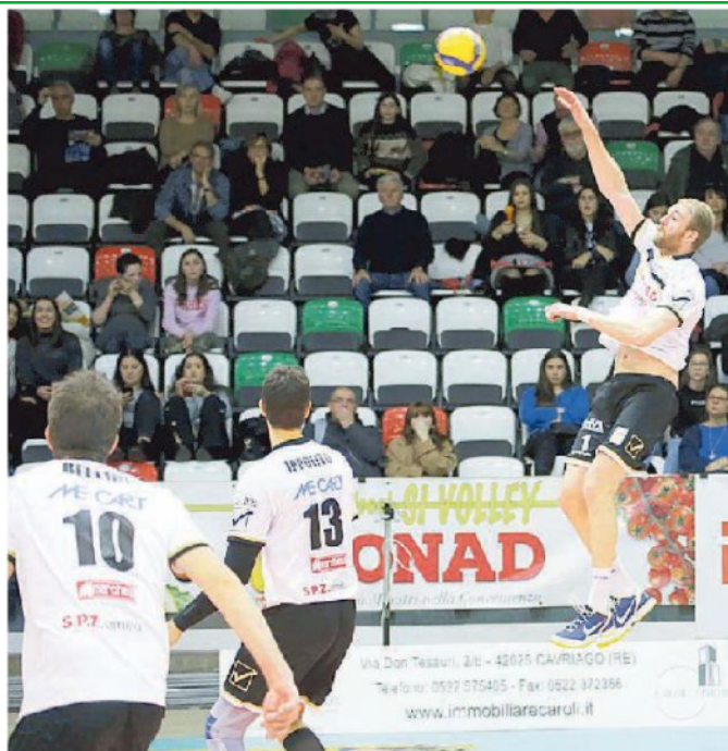
La Conad Volley domenica gioca in trasferta a Brescia